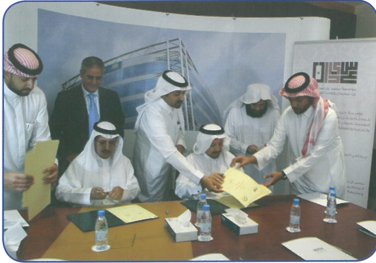
توقيع عقد كرسي آل سعيدان بين جامعة الطائف ومؤسسة محمد بن عبدالله بن سعيدان وأولاده الخيرية